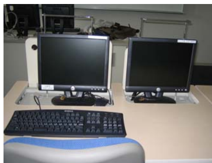
Fig.1. Une salle de classe « normale » équipée d'ordinateurs à l'UEO