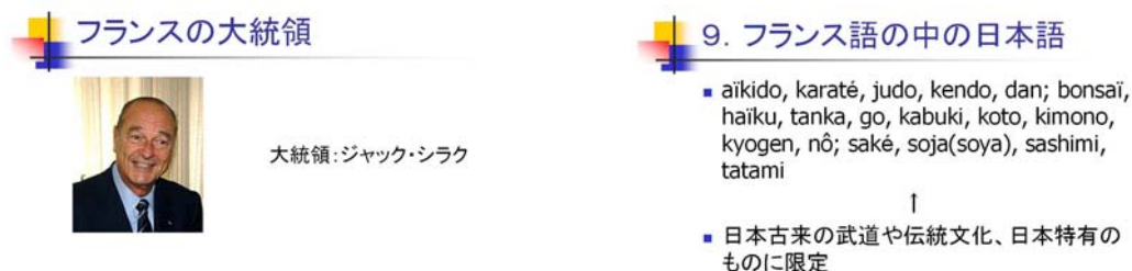
Fig.2 Présentation PowerPoint sur la France et les pays francophones

Nous pouvons trouver ces photos dans des sites comme Google Images ( http://images.google.co.jp/ ) ou Wikipedia ( http://ja.wikipedia.org/ ).